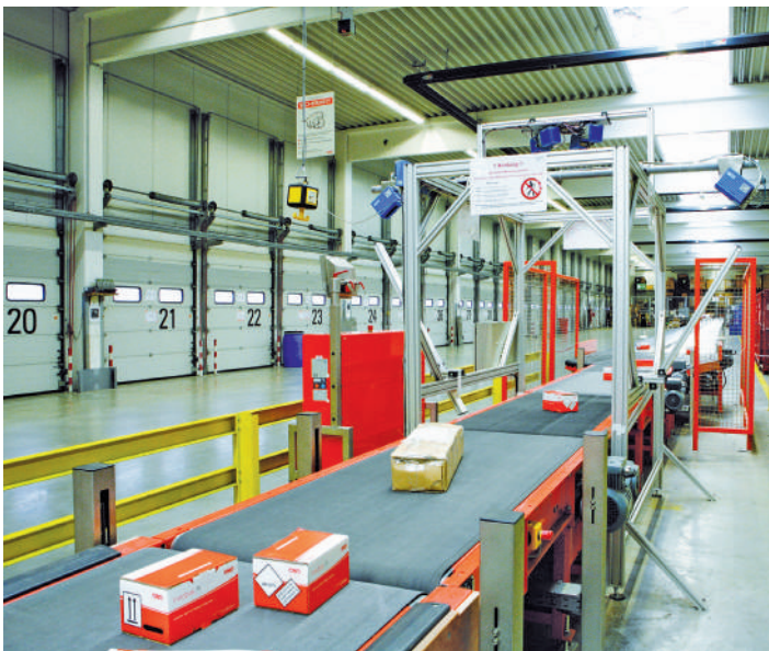
Paketstraße mit Waage und Volumenmessung

Das Messsystem kann als 1-Scanner-Lösung für die Vermessung ausschließlich quaderförmiger Objekte oder als 2-Scanner-Lösung für die Vermessung nahezu beliebig geformter Objekte geliefert werden. Die Identifikation der zu vermessenden Pakete erfolgt über automatische oder manuelle Strichcodelesung, über Transponder (RFID) oder über eine direkte Verbindung zur Materialflusskontrolle der Förderanlage. Einmal vermessen und registriert stellt das Messsystem 9750.70 die ermittelten Daten auf systemgerechten Schnittstellen weiterverarbeitender Systeme zur Verfügung – lückenlos dokumentiert. Das Messsystem ist für eichfähige Anwendungen nach MID oder OIML zertifiziert.